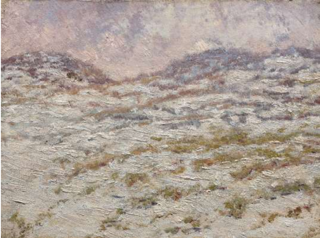
Georges Braque (1882-1963), Paysage de dunes , vers 1900, coll. part.