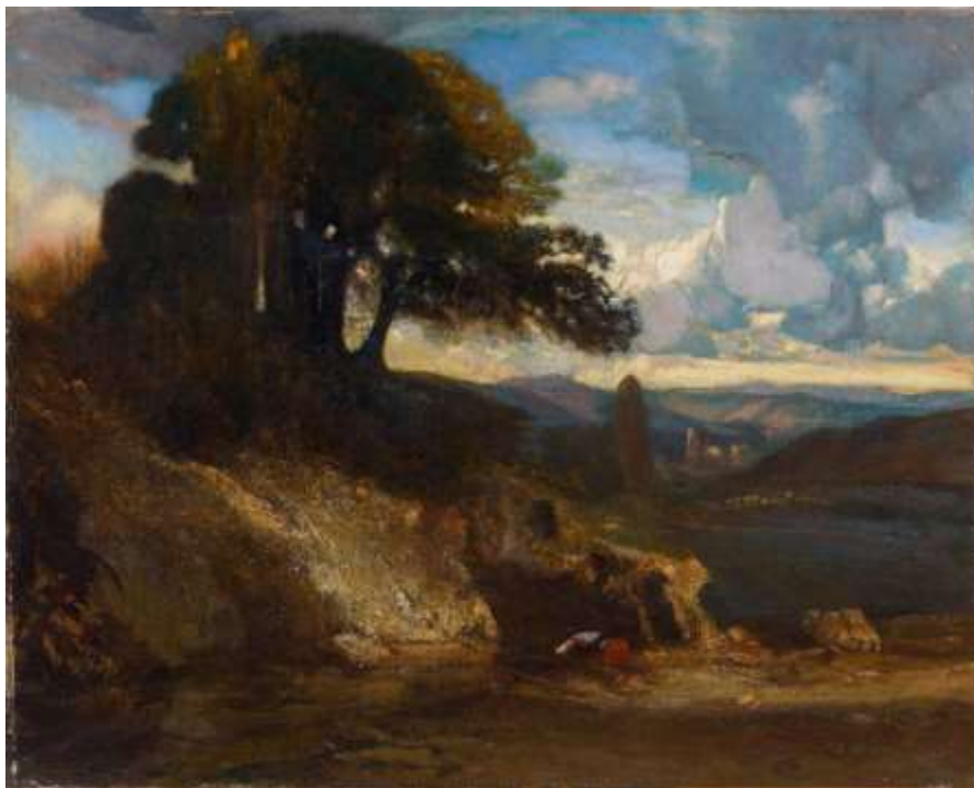
Alexandre Gabriel Decamps (1803-1860), Moïse devant le buisson ardent, vers 1842, coll. part.