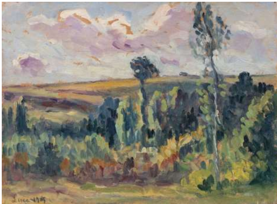
Maximilien Luce (1858-1941), Les Moulieux, coll. part.