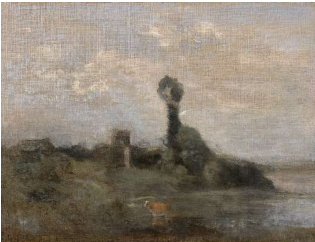
Jean Baptiste Camille Corot (1796-1875), Pâturages dominés par des ruines, vers 1865-1870, coll. part.