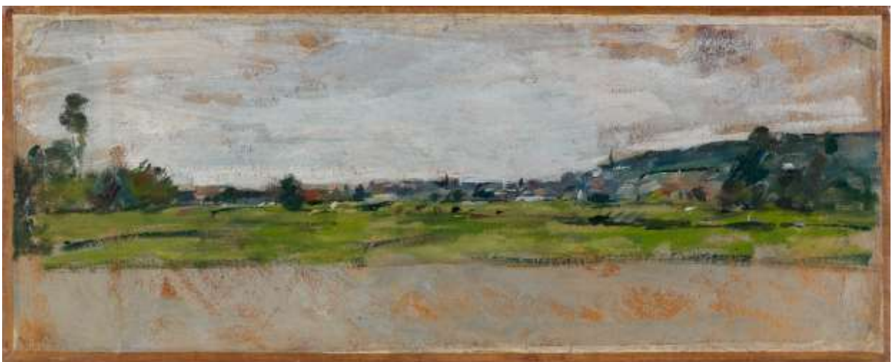
Eugène Boudin (1824- 1898), Les bords de la Touques, coll. part.