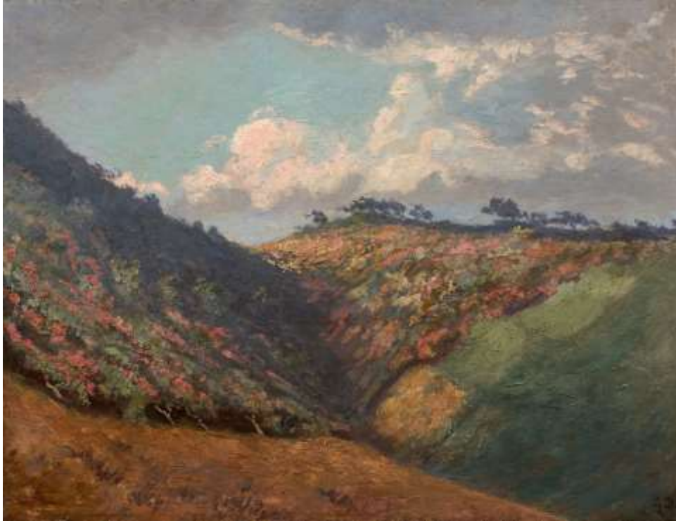
Gustave Doré (1832–1883) Vallée en Ecosse , coll. part. D.R.