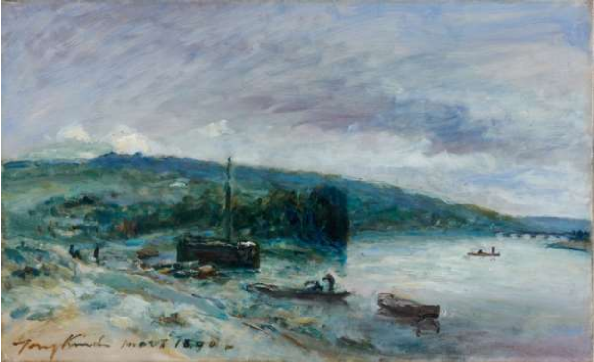
Johan Barthold Jongkind (1819-1891), La Seine à Meudon, coll. part.