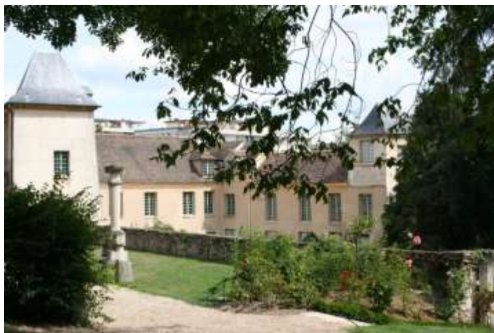
Musée d'Art et d'Histoire de la Ville de Meudon.

Tarifs : 4 € - 2 € - exonérations sur justificatifs.