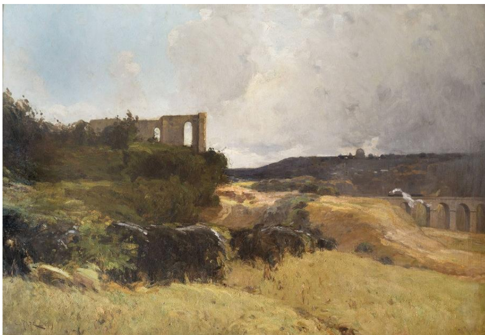
Les Molineaux (Meudon), 1909, huile sur toile, 128x196cm, Collections municipales de Vanves - Inscrit au titre des monuments historiques le 5 mai 2000.