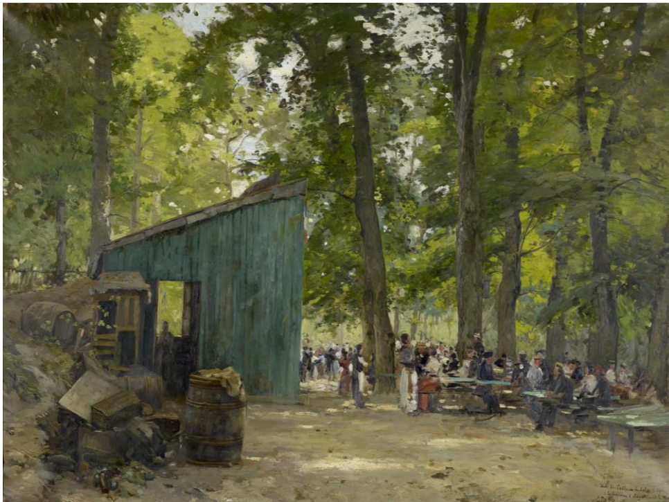
Etude pour le tableau du Salon de 1901 « Le Dimanche à la fontaine Saint-Marie, forêt de Meudon », 1901, 99x131 cm, collection du Musée Baron Martin à Gray.

Constant Pape complète ses revenus en exerçant en tant que restaurateur d'œuvres tout en remportant des concours pour des peintures décoratives pour des mairies d'Ile-de-France (Vanves, Noisy-le-Sec, Villemomble, Aubervilliers, Fresnes). L'essentiel de sa production concerne toutefois les paysages alto-séquanais au tournant du siècle, livrant une image fidèle de la banlieue entre paysages, vues de villes et fêtes champêtres.