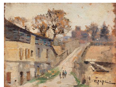
Trois peintures à l'huile sur panneaux de bois de 14x18 cm représentant des paysages meudonnais vers 1900. Collection du Musée d'art et d'histoire de Meudon