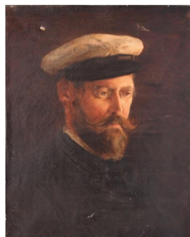
Frank Boggs, Autoportrait à la casquette, fin XIX e siècle, huile sur toile, Musée d'art et d'histoire de Meudon