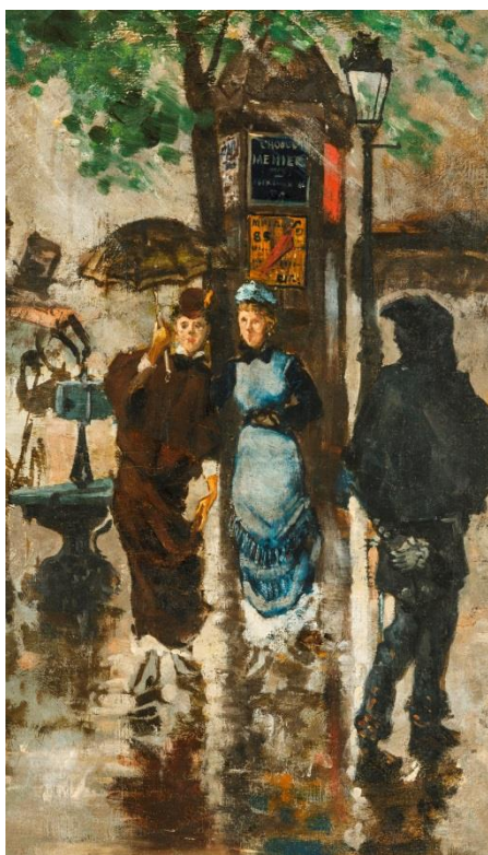
Frank Boggs, Boulevard sous la pluie, deux parisiennes, XX e siècle, huile sur toile, Musée d'art et d'histoire de Meudon

Le Musée d'art et d'histoire de Meudon consacre une prochaine exposition à l'œuvre du peintre post-impressionniste Frank Boggs (Springfield, 1855 – Meudon, 1926).