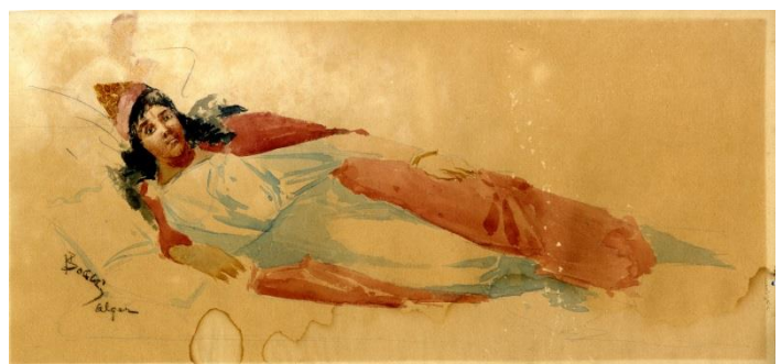
Frank Boggs, Femme d'Alger allongée, fin du XIX e siècle-début du XX e siècle, aquarelle, Musée d'art et d'histoire de Meudon

La sélection des œuvres présentées révèle l'hétérogénéité des pratiques et des sujets d'un peintre prolifique. Les toiles, non datées, sont parfois difficiles à contextualiser car Frank Boggs a peint, parfois à vingt ans d'intervalle, les mêmes paysages. Une étude attentive des signatures a permis toutefois de dater quelques réalisations restées encore inconnues. Ce sont les œuvres les plus intimes, celles conservées précieusement par l'artiste au fil de sa vie, qui sont présentée en fin de parcours.