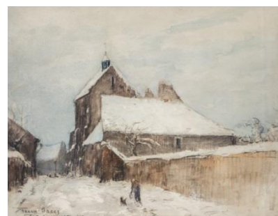
Frank Boggs, Eglise d'Autouillet début XX e siècle, aquarelle, Courtesy Galerie Brame Lorenceau