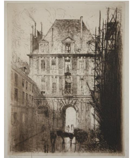
Frank Boggs, Rue de Birague, Paris, vers 1906, gravure à l'eau forte sur papier Musée d'art et d'histoire de Meudon

Au sein du parcours, une pièce reconstitue l'exposition de L'œuvre gravé de Frank Boggs qui a pris place du 17 mai au 11 juin 1921 à la galerie d'Hector Brame à Paris avec la présentation d'une trentaine d'estampes, certaines éclairées par les commentaires savoureux du catalogue d'exposition de 1921.