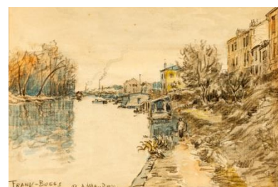
Frank Boggs, Bas Meudon entre 1923 et 1926, dessin aquarellé, Musée d'art et d'histoire de Meudon