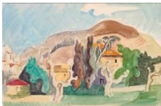
André LHOTE, Paysage du midi , aquarelle, 1932