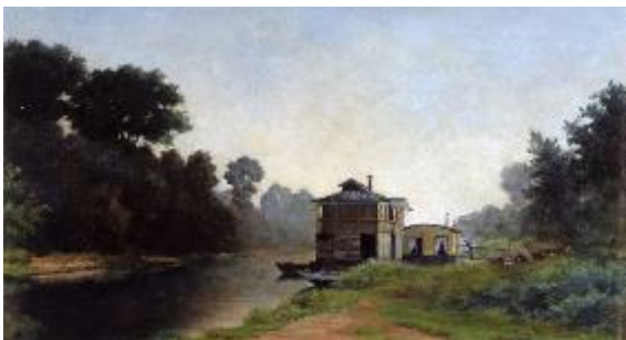
Emile SCHUFFENECKER, Bateau-lavoir au Bas-Meudon , huile sur toile, 1881

Le Musée d'art et d'histoire de Meudon propose une exposition dédiée à la peinture de paysage. Issue de sa riche collection sortie exceptionnellement des réserves, cette exposition retrace plus d'un siècle d'histoire du paysage (1830-1950) à travers une cinquantaine d'œuvres : peintures, estampes et dessins. Des grands peintres paysagistes (Huet, Daubigny, Guillaumin, Lhote) aux petits maîtres (Tauzin, Pape), l'exposition Évasion : la peinture de paysage sort des réserves dresse un subtil panorama de la représentation de la nature au fil des siècles, de la plus classique à la plus abstraite.