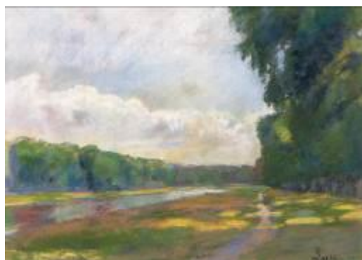
Maximilien LUCE, Le bras du fleuve , huile sur toile, 1847