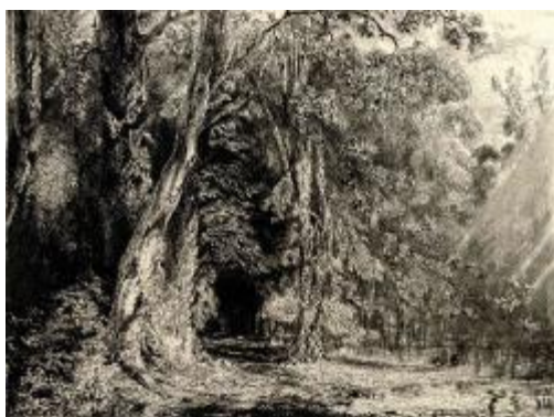
Paul HUET, Inondation dans l'île Seguin , eau-forte, milieu du XIXe siècle