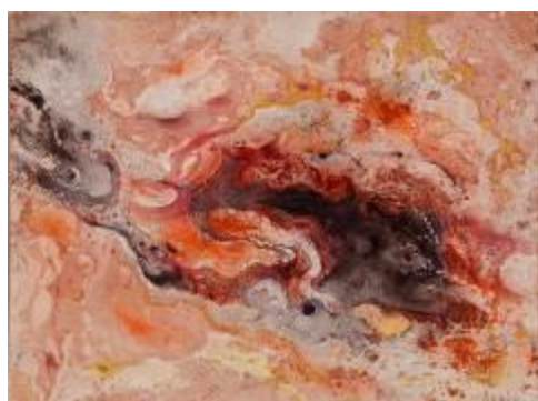
Louise JANIN, Volcanique (cosmogramme) , vers 1950

Les estampes illustrent également l'intérêt des artistes pour les techniques modernes, dites d'imprimerie, pour la diffusion de leurs œuvres. Paul Huet ou Felix Bracquemond excellent dans cette technique qui acquière ses lettres de noblesse au cours du XIX e siècle.