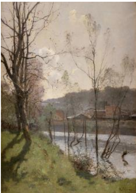
Louis-Germain PELOUSE, La Seine au Bas-Meudon , huile sur toile, vers 1885

Vernissage : Vendredi 16 septembre 2022 à 19h