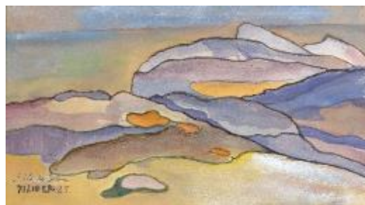
Charles FILIGIER, L'île de Sein , aquarelle, 1925